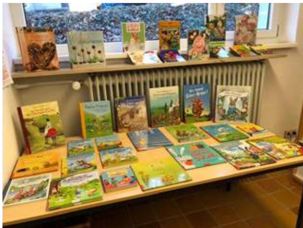
Büchertisch zum Thema Ostern.

Im Bilderbuch von Alexander Stefensmeier kann es die Kuh Lieselotte kaum erwarten, ihren Stall zu verlassen und die Schnauze in den Frühlingswind zu recken. Die Schmetterlinge flattern fröhlich über die Wiese, die Blumen duften herrlich und auf dem Bach kann man Papierboote fahren lassen. Aber warum versteckt die Bäuerin bunte Eier im Gemüsebeet? Ostern steht vor der Tür und in der Gemeindebücher gibt es dazu eine kleine Ausstellung mit Bastel-, Sach- und Geschichtenbüchern.