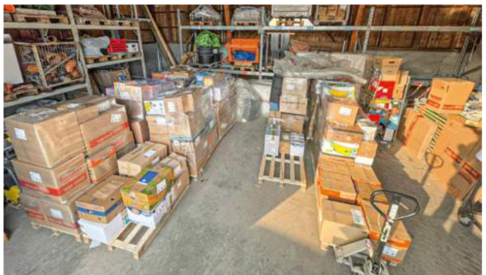
Norbert Stumpf Erster Bürgermeister